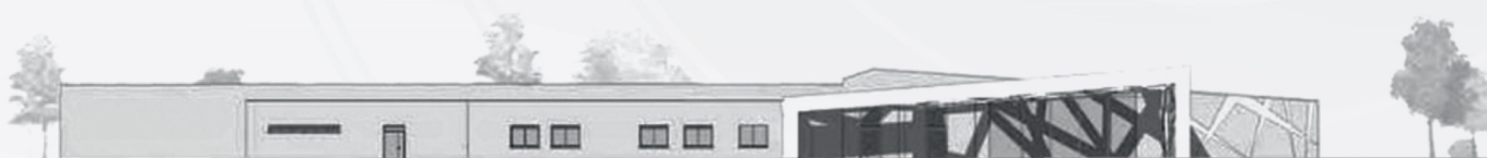
Centre National de Tir Sportif - Châteauroux-Déols